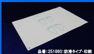
品番:251860:防滑タイプ・印刷